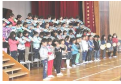
鍵盤ハーモニカ演奏