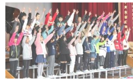
手話を取り入れた合唱