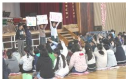
アンケートクイズ