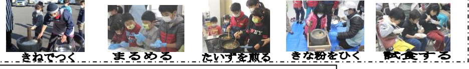
きなでつく まるめる たいずを取る きな粉をひく 餅食する