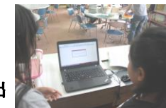
パソコンによる本の貸出

また、本の貸し出し数や人数、児童個人の読書歴も6年間にわたって記録できるようになりました。とても素晴らしいシステムの構築をありがとうございました。