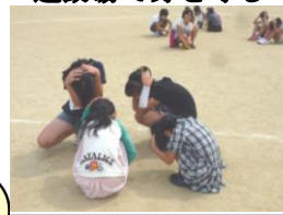
身体教育・防災教育

8月23日(日)、本部役員、各専門部、学級委員、社会体育関係の皆さん方により、暑い中、校内の草刈り、側溝の清掃、トイレのシッパマーク補修、体育館のワックスがけ等の奉仕作業をしていただき、ありがとうございました。